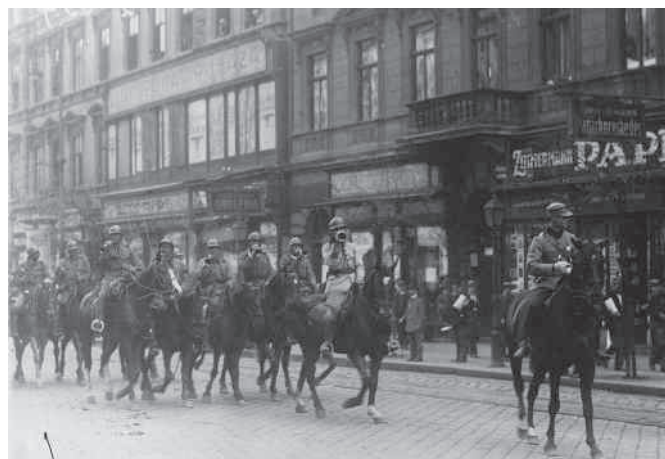
Román katonák Budapesten

A dunántúli „fővezérség” kialakulásával javult valamennyit az anarchiába süllyedt ország helyzete. Volt végre egy hatalmi tényező, melyet a nyugat is komolyan vehetett. A hajdani vörös terror nyomán viszont dült a