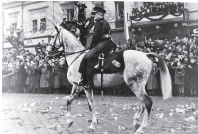
nagybányai Horthy Miklós bevonul Budapestre

„fehér” terror, mely a hajdani vörösök, zsidók – a tanácsköztársaság vezetésének jó része zsidó származású volt – elleni leszámolást tűzte ki céljául. Bár utóbb gyakran vetették a szemére, Horthy sosem adott parancsot az atrocitásokra, semmilyen formában nem járult hozzájuk.